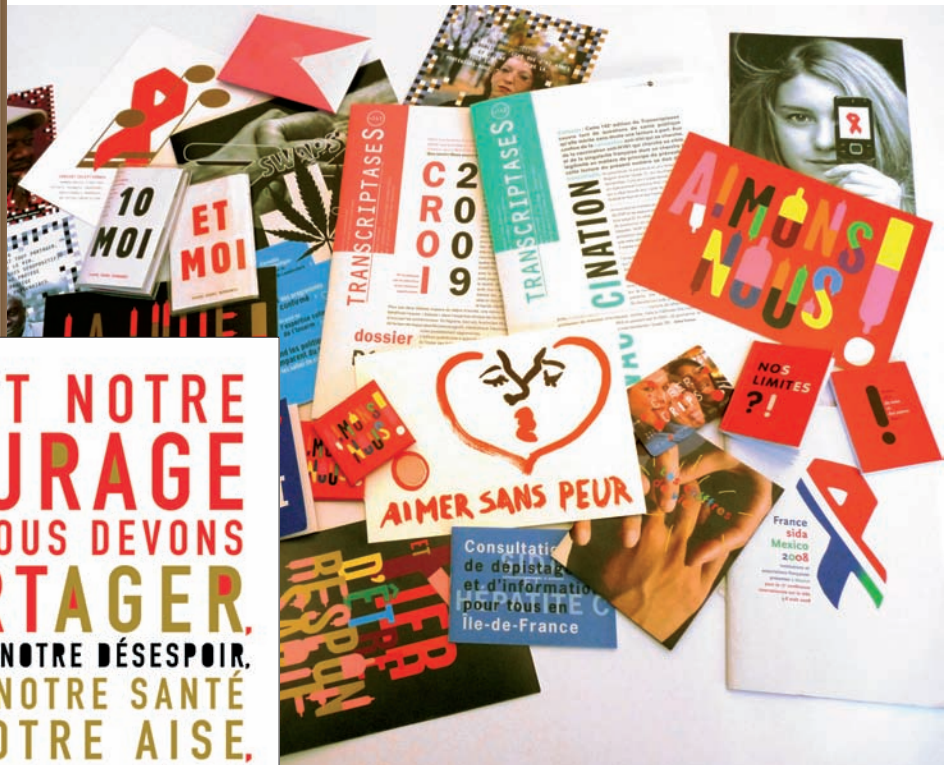
MATÉRIEL D'INFORMATION ET DE SENSIBILISATION CRIPS